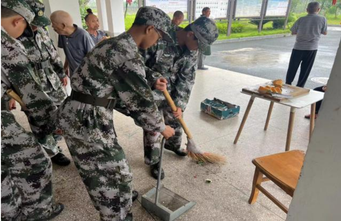
图片 9：服务社区“敬老爱老，奉献爱心”活动。

活动，通过自己的一份努力，为社会做一份贡献，树立榜样，营造全社会无私奉献的良好风尚，培养和提升公民的社会公德意识。