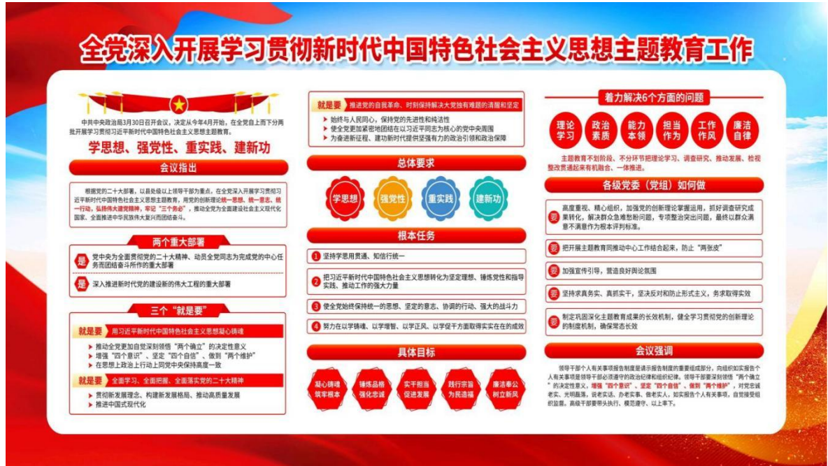
图片 1：关于深入学习贯彻新时代中国特色社会主义思想主题教育导图。

(2) 加强红色教育。培养学生从小继承优良革命传统的品质。学校不仅重视红色教育宣传，更注重红色教育传承。近年来学校支部和校团委多次组织老师学生前往红色革命基地（上饶集中营、怀玉山、方志敏故居）进行红色革命教育，一次次的革命先烈英雄事迹象无声的细雨，洒向孩子们的心田，让学生充分了解现在的生活来之不易，也让每一位学生牢记革命先辈们的艰苦奋斗、卓绝贡献，以此激励学生更加努力的学习，树立为国争光的人生观。