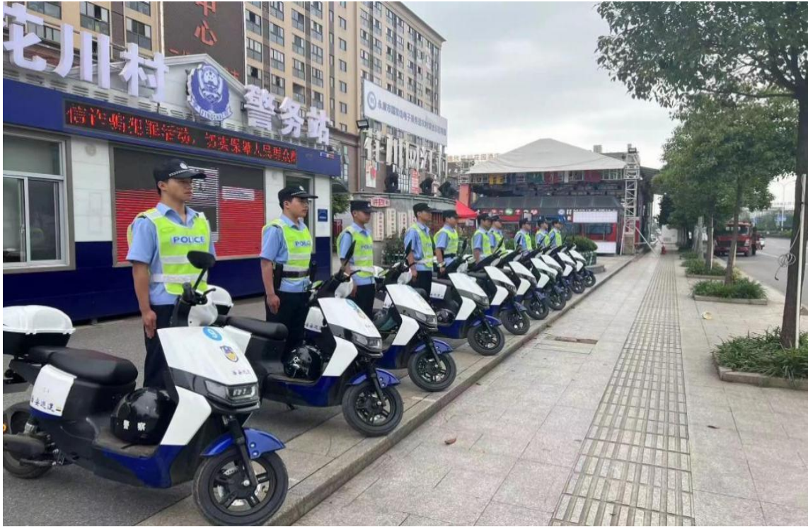
图片 8：我校学生在永康市西城派出所警务站实习值勤照。