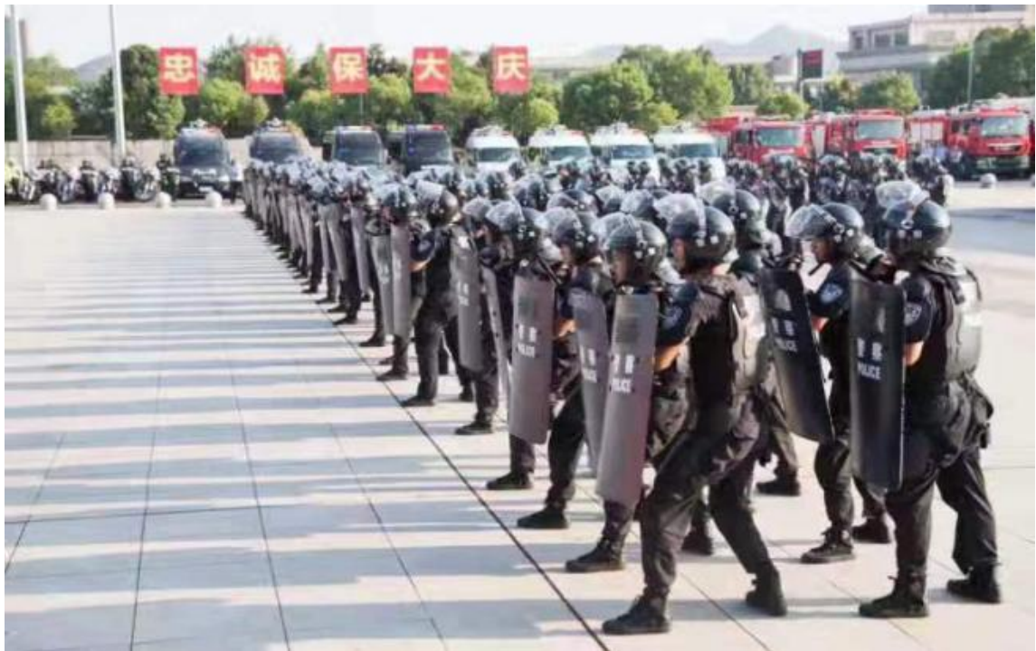
图片 7：我校学生在永康公安实习汇报演出。

上饶市安防工程学校现有在校生 2000 余人，已成为地方企业高技能人才培养基地，常年面向长三角及周边区域贡献人才，积极助力区域经济发展。2023 届毕业生就业量较大的城市主要是南昌、上饶、深圳、永康、杭州、芜湖、宁波等地，毕业生主要就业领域为公安系统、交通运输及设备制造业等，有力支撑了当地产业发展体系建设。