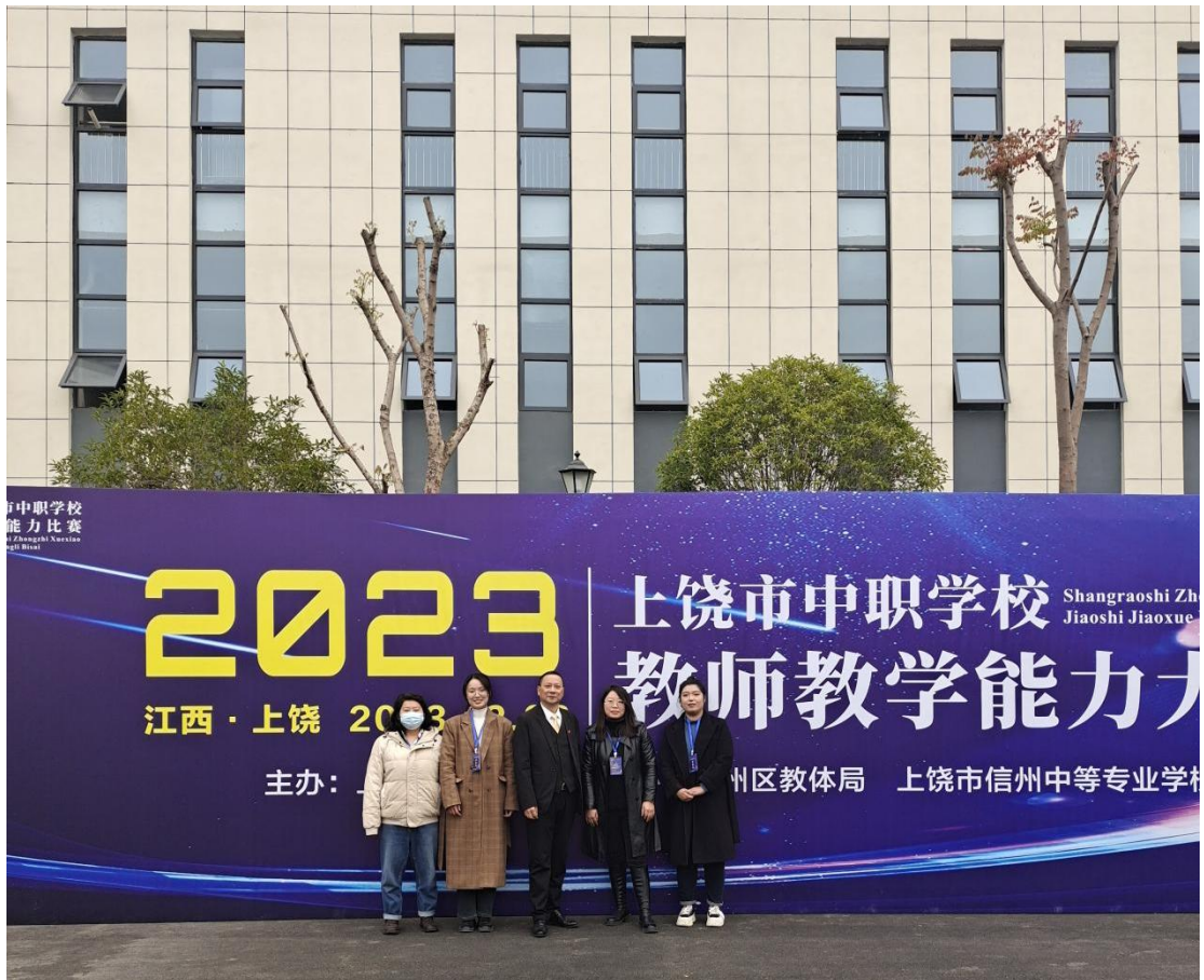
图片 4：上饶市中职学校教师教学能力大赛现场。