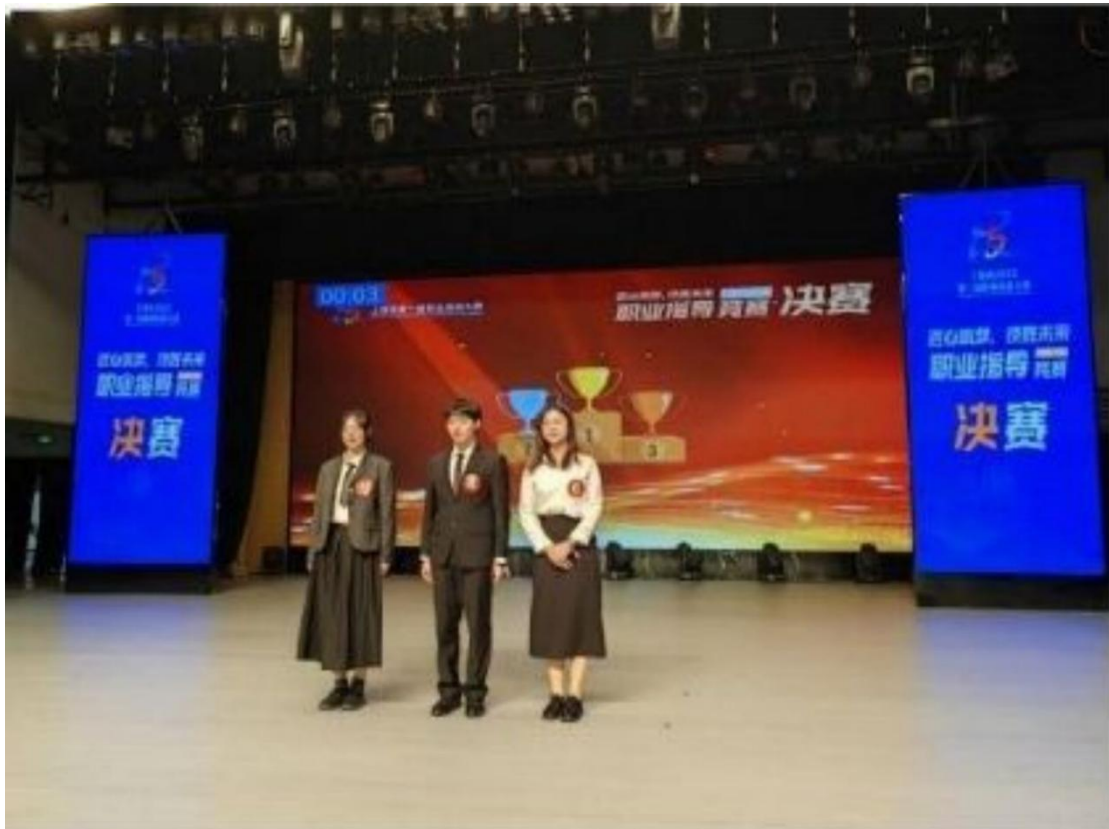
图片 3：职业技能大赛决赛现场。

学校坚持个性发展和全面发展相结合的培养原则，坚持文化基础课、专业理论课、专业技能课同步。通过开展社会实践、社团活动、文明风采竞赛、创新创业大赛等多种形式的第二课堂活动，提高学生的综合素质，使学生的综合学习能力、岗位适应能力、岗位迁移能力、创新创业能力均衡发展。根据对毕业生的跟踪调查和用人单位的反馈情况，我校的毕业生岗位适应能力、迁移能力和创新创业能力稳步提升。