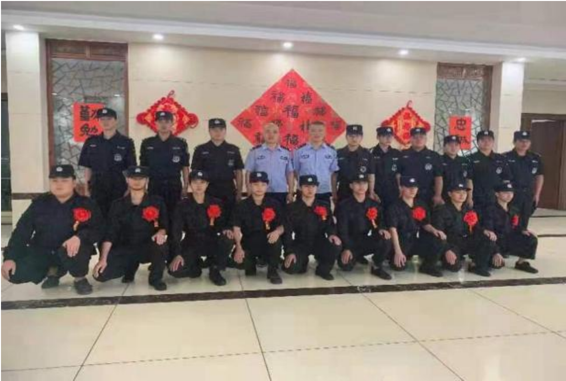
图片 10：我校学生在永康市公安局入职照